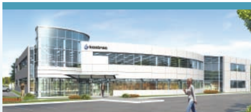
Une perspective du futur immeuble de la rue Ambroise-Lafortune, à Boisbriand, qu'intégrera Kontron Canada au début du printemps 2009.

Kontron Canada excelle dans la fabrication d'ordinateurs industriels, qu'elle exporte partout dans le monde, pour des applications de haut niveau dans des domaines spécifiques tels les réseaux voix et données, l'imagerie médicale et l'équipement de casino. Son chiffre d'affaires s'est accru de 20 à 25 % par année au cours des quatre derniers exercices. [ www.kontron.com ]