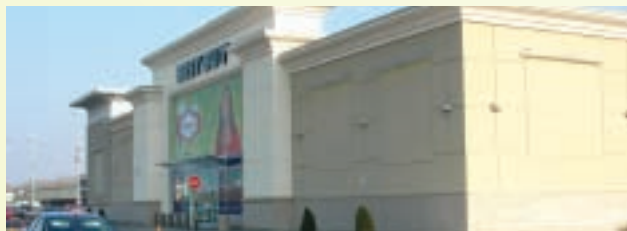
Le nouveau Best Buy de 2 600 m 2 construit par la Place Rosemère en 2008.

Cette réalisation a été rendue possible grâce à un partenariat avantageux avec Place Rosemère, qui y a consacré 6,3 M$. [ www.bestbuy.ca ]