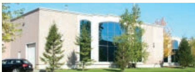
L'usine du Maître Saladier applique des mesures élevées de contrôle, dont les normes HACCP.

L'investissement de 8,5 M$ a aussi servi à implanter une ligne de fabrication de savoureuses crêpes garnies surgelées. Commercialisées sous la marque À table ! , elles sont vendues dans les grandes chaînes d'épicerie et les Clubs Entrepôts Costco du Québec, de l'Ontario et des Maritimes, de même que dans l'Est et l'Ouest américain.