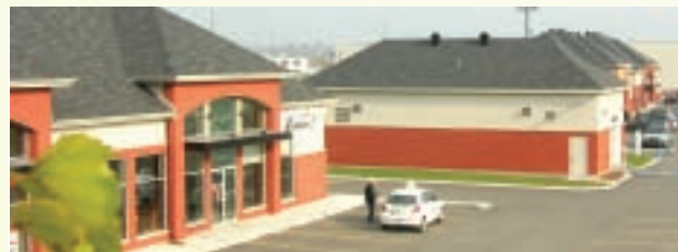
L'attrait de ce centre commercial de Bois-des-Filion se traduit par un achalandage élevé.

Les nombreux travailleurs du secteur autant que les familles du quartier résidentiel avoisinant ont applaudi l'arrivée des commerces qui se sont nichés dans cet immeuble qui a pignon sur rue au 900, boulevard Industriel. Le bâtiment regroupe des services de proximité qui ont généré plusieurs emplois.